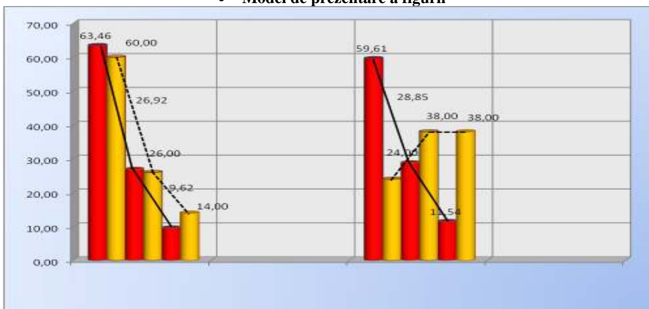
Figura 3.8. Rezultatele intervenției experimentale, %